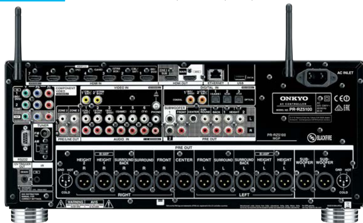
Текст на ресивере может отличаться в зависимости от региона.